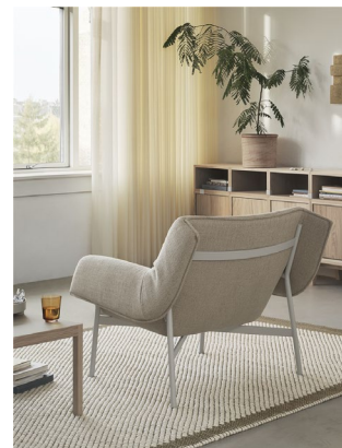
Wrap Lounge Chair

会場：DESIGNART GALLERY 東京都港区北青山2-7-15 NTT青山ビル1F (エスコルテ青山)