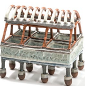
Architecture versus Nature #1