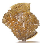
Gleamin' in the Golden フローチ デンマーク政府芸術財団所蔵 / Per Suntum