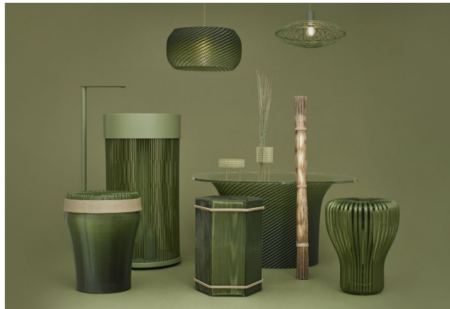
製造/材料開発支援：株式会社ExtraBold 素材提供：株式会社イケヒコ・コーポレーション