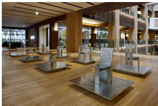
FLOW by Daisuke Yamamoto at Roppongi MIDTOWN